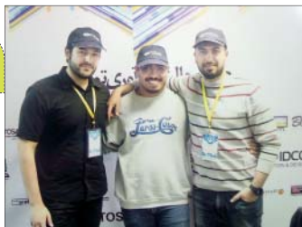
اعضای تیم دراپز

هر یک از کسب و کارهای نوپا دچار مشکلات و دغدغه‌هایی هستند که هر روز شکل جدیدی به خود می‌گیرند.